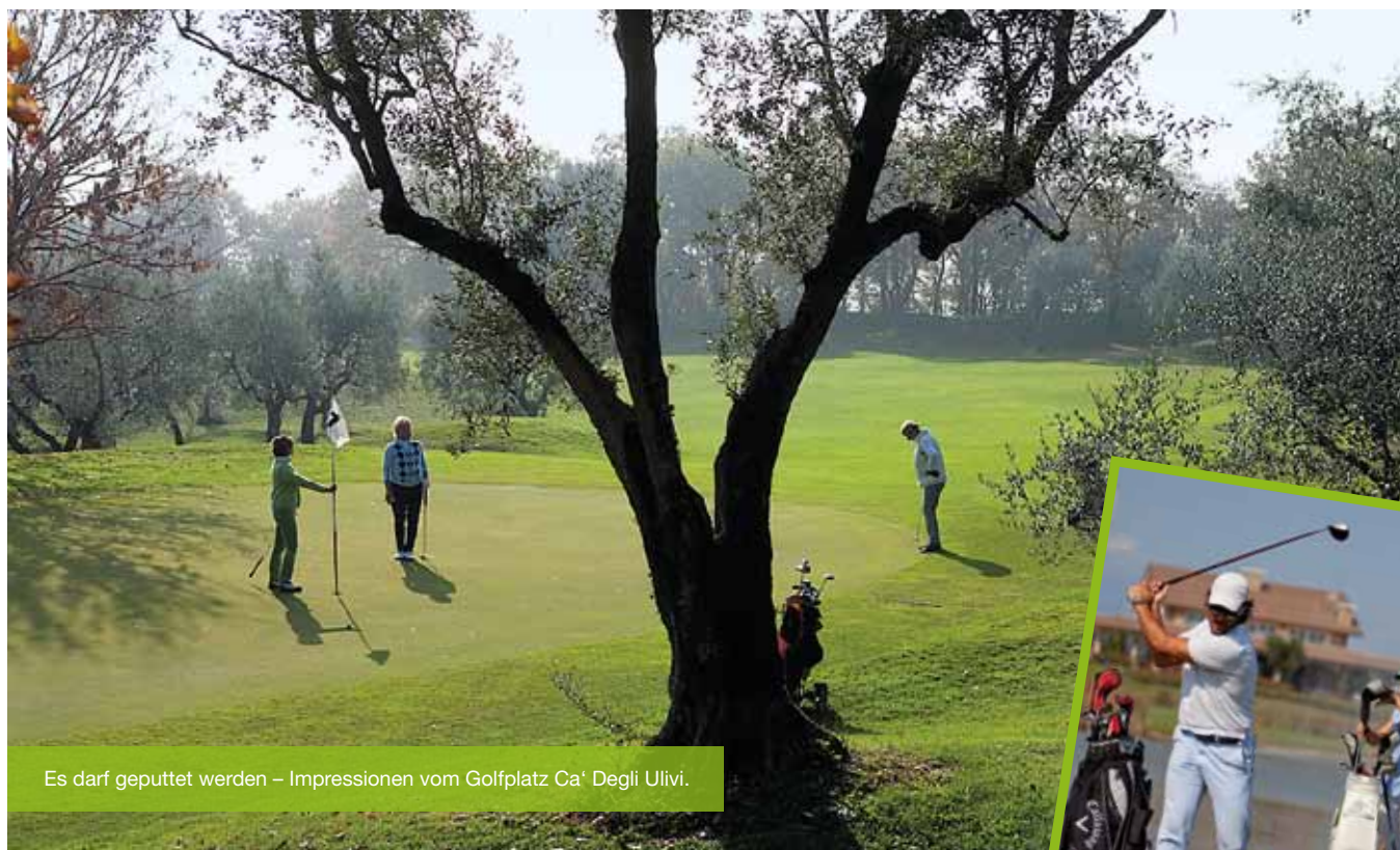
Es darf geputtet werden – Impressionen vom Golfplatz Ca' Degli Ulivi.

tegisches, präzises Spiel gefragt. Im Hochsommer fehlt hier im Vergleich zu Garda Golf der oftmals nötige Schatten, aber die Anlage ist ja noch wesentlich jünger. Insgesamt ein sportlicher Platz.