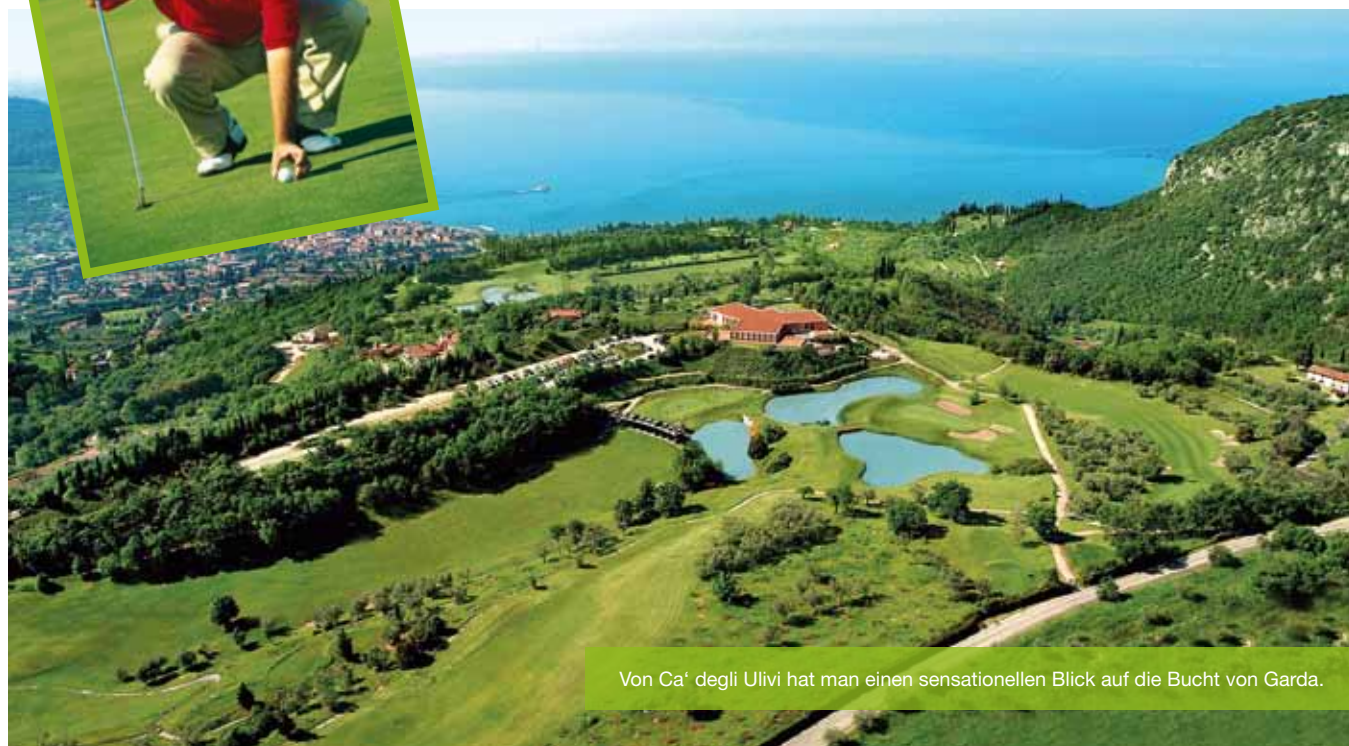
Von Ca' degli Ulivi hat man einen sensationellen Blick auf die Bucht von Garda.