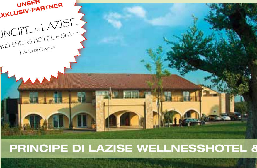
PRINCIPE DI LAZISE WELLNESSHOTEL & SPA

PRINCIPE DI LAZISE — WELLNESS HOTEL & SPA — LAGO DI GARDA