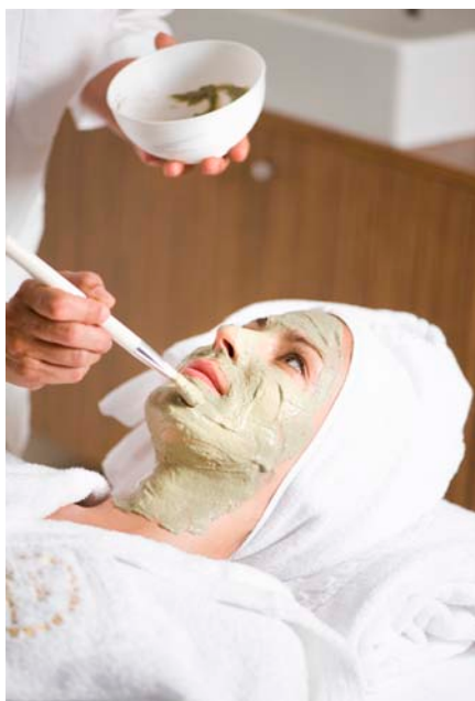
Beautyanwendungen im Hotel Villa Madrina - Garda

Die ganzjährig geöffnete Hotelanlage verfügt über 2 Hallenbäder, 3 Freibäder und 2 Kinderpools. Im großen Thermal- und Wellness-Bereich gibt es Calidarium, finnische Sauna, Mediterraneum, Erlebnisduschen, Frigidarium, Kaltwasserfall, eine Massagezone, weitläufige Ruhezone und ein umfassendes Angebot an Beautybehandlungen.