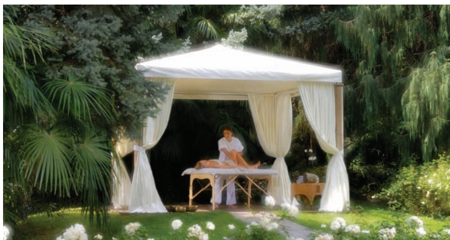
Massage im Freien: Du Lac et Du Parc Grand Resort - Riva del Garda

Das 11.500 m 2 große, äußerst gepflegte Hotelareal von Corte Valier an Lazises Südufer ist für Erholungssuchende geschaffen. In dieser fünf Gehwegminuten von der Altstadt entfernten Oase wurde alles großzügig gehalten, die Zimmer, der Beauty- und Wellnessbereich, der Indoor-Pool, der Garten. Ein großzügiger Blick über den gesamten südlichen Gardasee macht das Urlaubsfeeling perfekt.