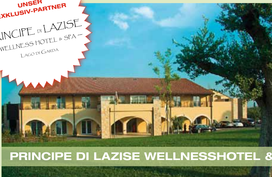
PRINCIPE DI LAZISE WELLNESSHOTEL & SPA

PRINCIPE DI LAZISE — WELLNESS HOTEL & SPA — LAGO DI GARDA