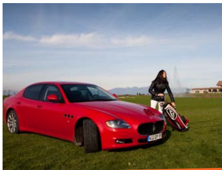
Optimale Spielbedingungen auf dem Chervò Golfplatz in Pozzolengo

Unterschied zu mir ein guter Spieler, war begeistert vom Zustand des Platzes und auch von den Herausforderungen, die er guten Handycap-Spielern abverlangt. Ein Glas Luganawein auf der einladenden Terrasse des Clubhauses mit herrlichem Blick auf den Platz rundet unser Spiel ab. Apropos Lugana, da fällt mir ein, dass es in der Nähe ein Weingut gibt, das auch optisch interessant ist. Wir chauffieren unser Luxusgefährt, dank dem uns immer eine respektvolle Beachtung gewiss ist, zum neuen Weingut „Perla del Garda“.