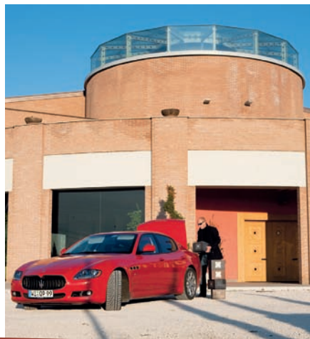
Weinkauf im Weingut La Perla – dank großen Kofferraums kein Problem

Endlich sind wir auf der italienischen Seite angekommen und nun beginnt, nach bequemem Dahinrollen, der echte Fahrspaß. Der Quattroporte Sport GT S zeigt nun, was in ihm steckt! Die Kurvenlage ist sensationell und dank wenig Verkehr können wir das auch in vollen Zügen genießen – gottlob ohne Polizeikontrolle, nach dem Motto: no risk no fun! Besonders funny ist der „Sportknopf“, der dem Maserati noch mehr Power und vor allem seinen unverkennbaren Sound verleiht. Vergnügt und entspannt steuern wir unser erstes Ziel auf der Westseite des Gardasees an.