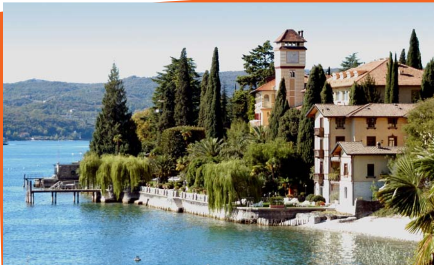
Seefeeling pur erlebt man im wunderschön gelegenen Grand Hotel Fasano